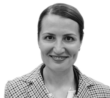
Ольга Стефанишина, заступниця Міністра охорони здоров'я

Ще один важливим кроком є утворення централізованої закупівельної організації — ДП «Медичні закупівлі України». Саме вона має впровадити професійні стандарти і процедури, щоб поширити досвід прозорих ефективних закупівель через міжнародні організації на закупівлі ліків на місцевому рівні. Підприємство вже починає закуповувати ліки та медичні вироби за кошти гранту Глобального фонду для боротьби зі СНІДом, туберкульозом та малярією. Триває робота над створенням пілотного проекту електронного каталогу, який дасть можливість лікарням та іншим державним закладам