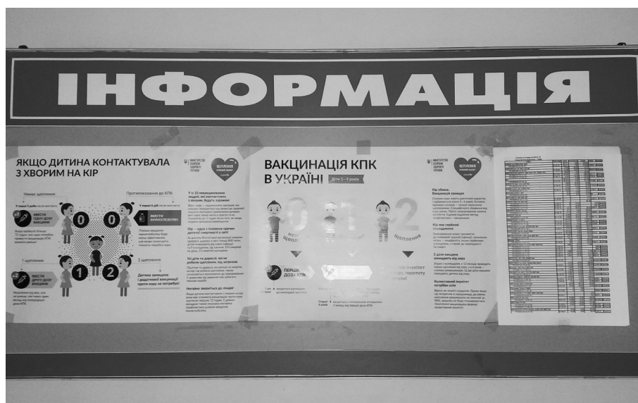
Інформація про наявність ліків у Житомирській ЦРЛ

За 2018 р. у цілодобовому стаціонарі пройшли лікування 8 154 пацієнти, у 2017 р. — 7 833 пацієнти. Фактичні видатки на медикаменти на один ліжко-день у 2018 р. склали 39,42 грн, у 2017 р. — 28,26 грн. Серед районів області цей показник за шість місяців 2018 р. становив у середньому 12,71 грн.